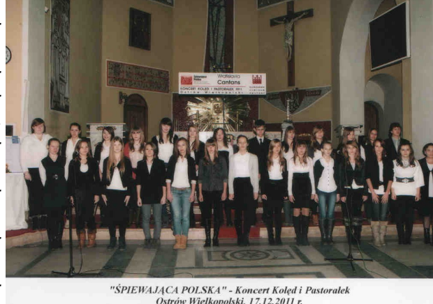
"ŚPIEWAJĄCA POLSKA" - Koncert Kołęd i Pastoralek Ostrów Wielkopolski, 17.12.2011 r.