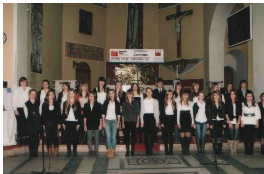
„ŚPIEWAJĄCA POLSKA” - Koncert Kołęd i Pastorałek Ostrow Wielkopolski, 17.12.2011 r.

W dorocznym Koncercie Kołęd, który odbył się 17 grudnia 2011 roku w Kościele p.w. św. Antoniego, w ramach Ogólnopolskiego Programu Rozwoju Chórów